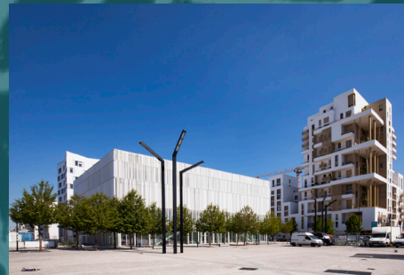
Le Centre de colloques vu de la place du Front populaire