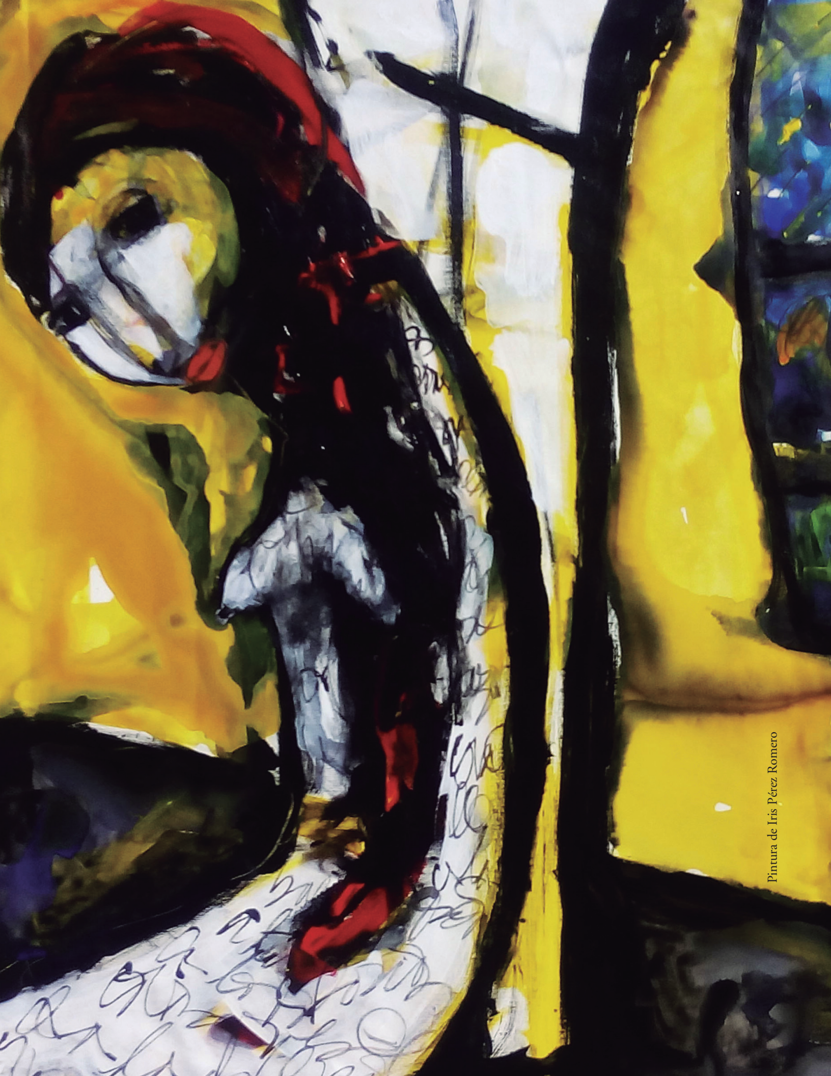
Pintura de Iris Pérez Romero