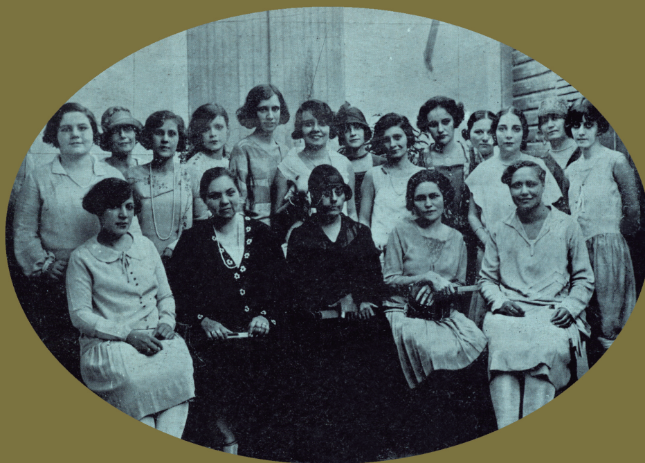
90° Aniversario de la Fundación del Club "Nosotras" (1927).