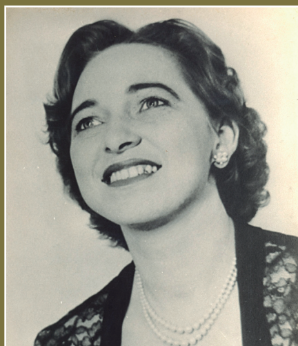
Centenario de Nacimiento de Carmen Natalia (1917-1976).