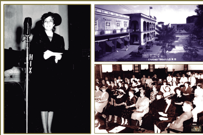
75° Aniversario de la Ciudadanía y del derecho al voto de las mujeres de la República Dominicana (1942-2017).