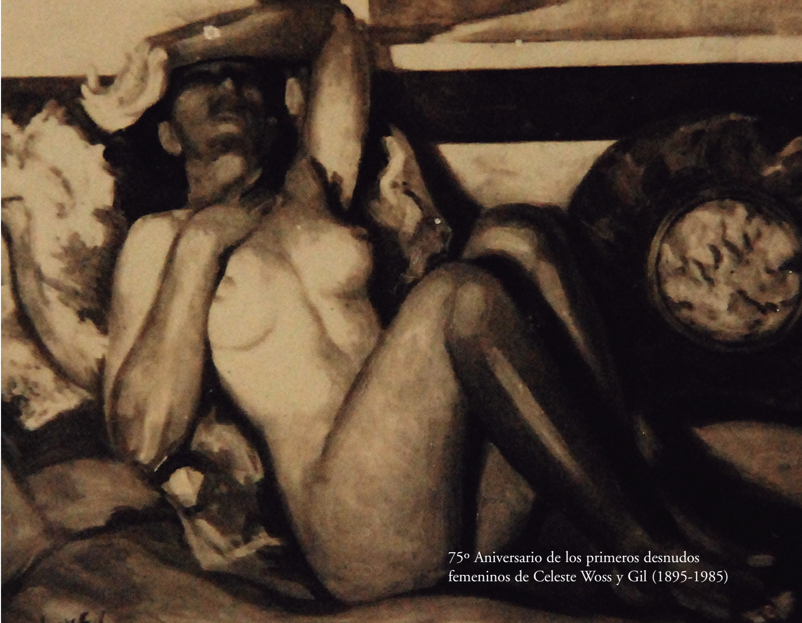
75° Aniversario de los primeros desnudos femeninos de Celeste Woss y Gil (1895-1985)